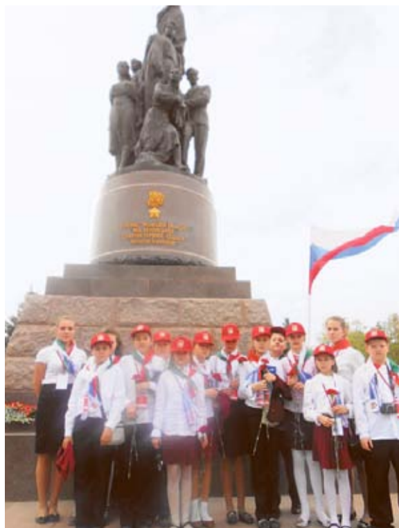
Школьники из Кунцева в Краснодаре