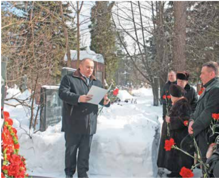
На страже порядка