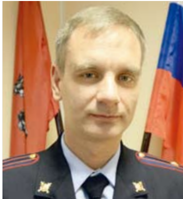
Новолучанская: д. 5, д. 7 к. 1, частный сектор Василия Ботылева: д. 14,16,18 Москворецкая: д. 7,8,9,11 ООО «РЭП» ДЕЗ «ИС Кунцево» детский сад (новый)