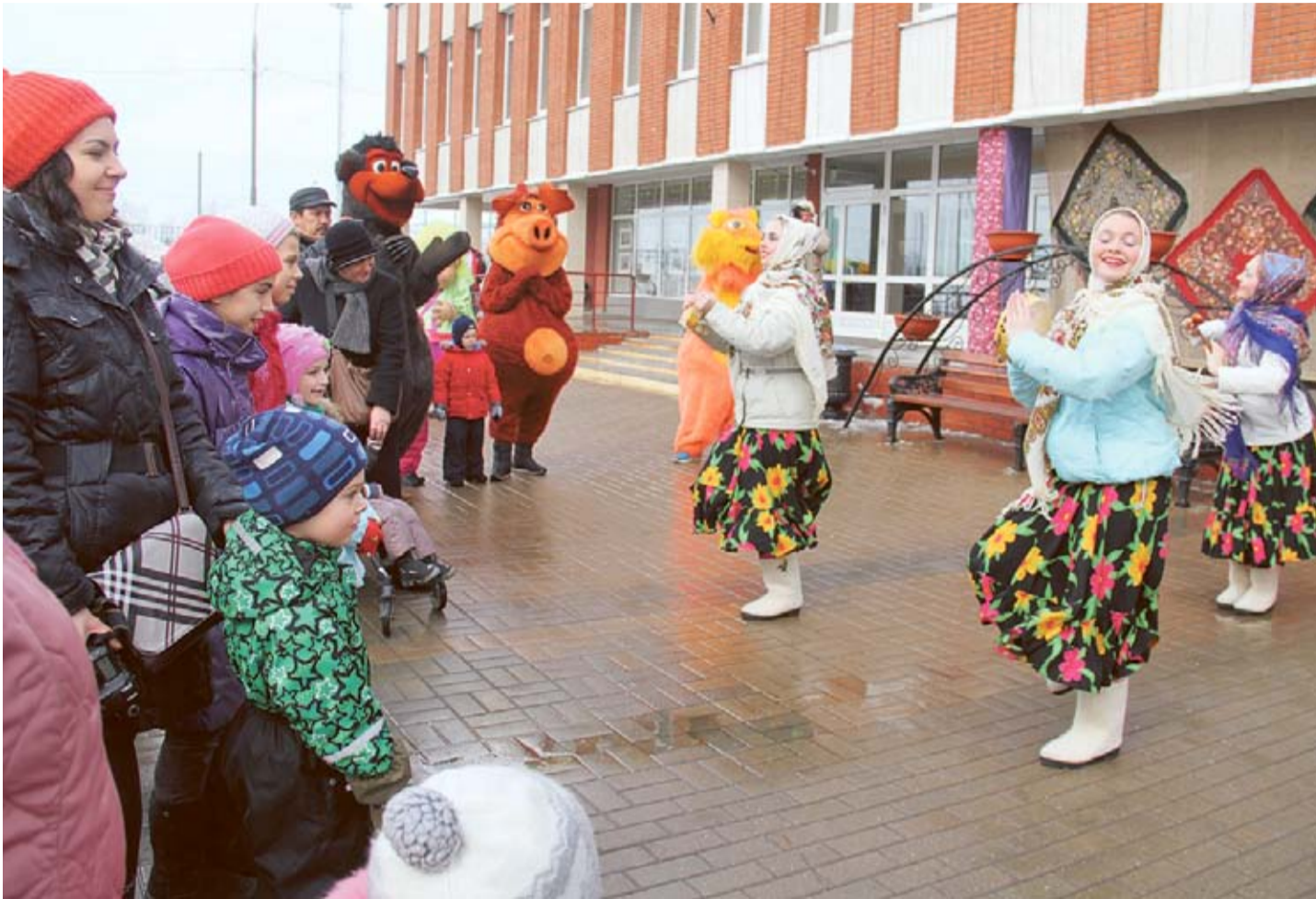
Ансамбль народного танца «Россиянка» задавал тон празднику