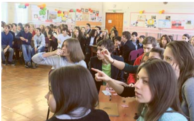
Познавательные игры вызывают интерес у школьников...

— Мы рассказываем ребятам о том, какие существуют политиче-