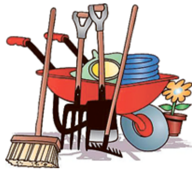
Управа района Кунцево

Желающие внести свой вклад в наведение чистоты на территории Кунцево могут получить инвентарь непосредственно на участках, осуществляющих обслуживание их территории.